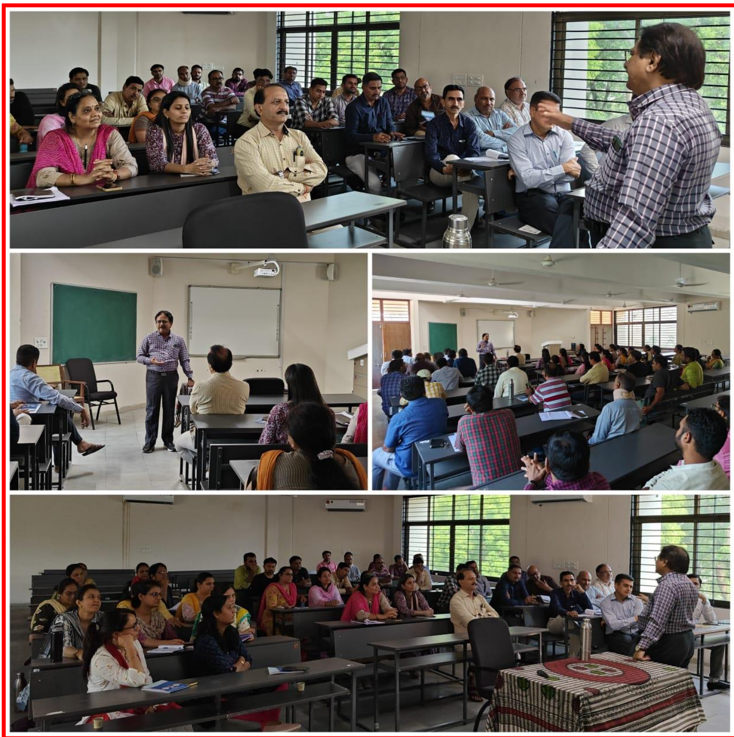
(Pictures of Day 3 of Capacity Building Week was organized by Government Science College, Gandhinagar from 19 June 2023 to 24 June 2023.)