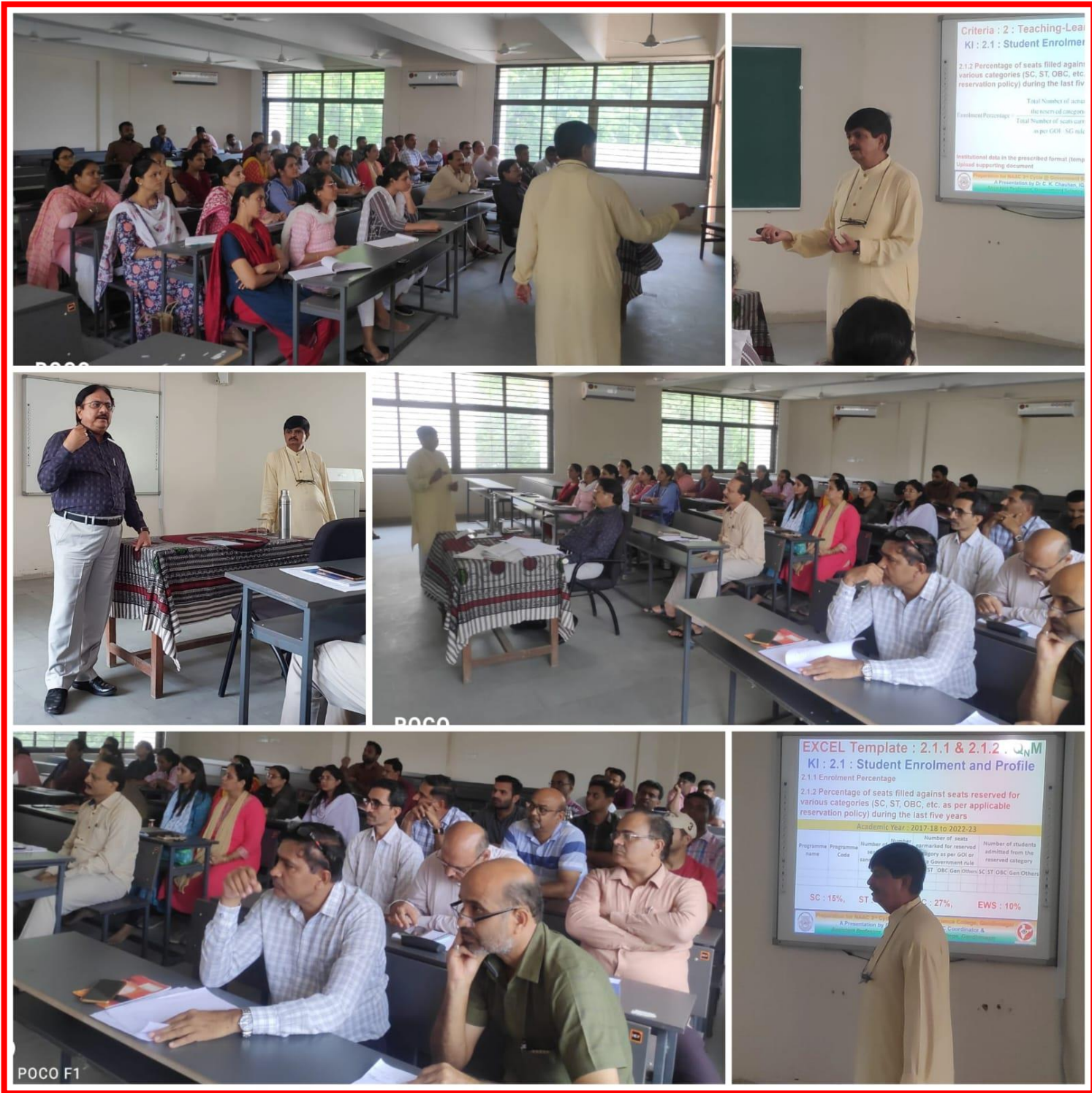
(Pictures of Day 5 of Capacity Building Week was organized by Government Science College, Gandhinagar from 19 June 2023 to 24 June 2023.)