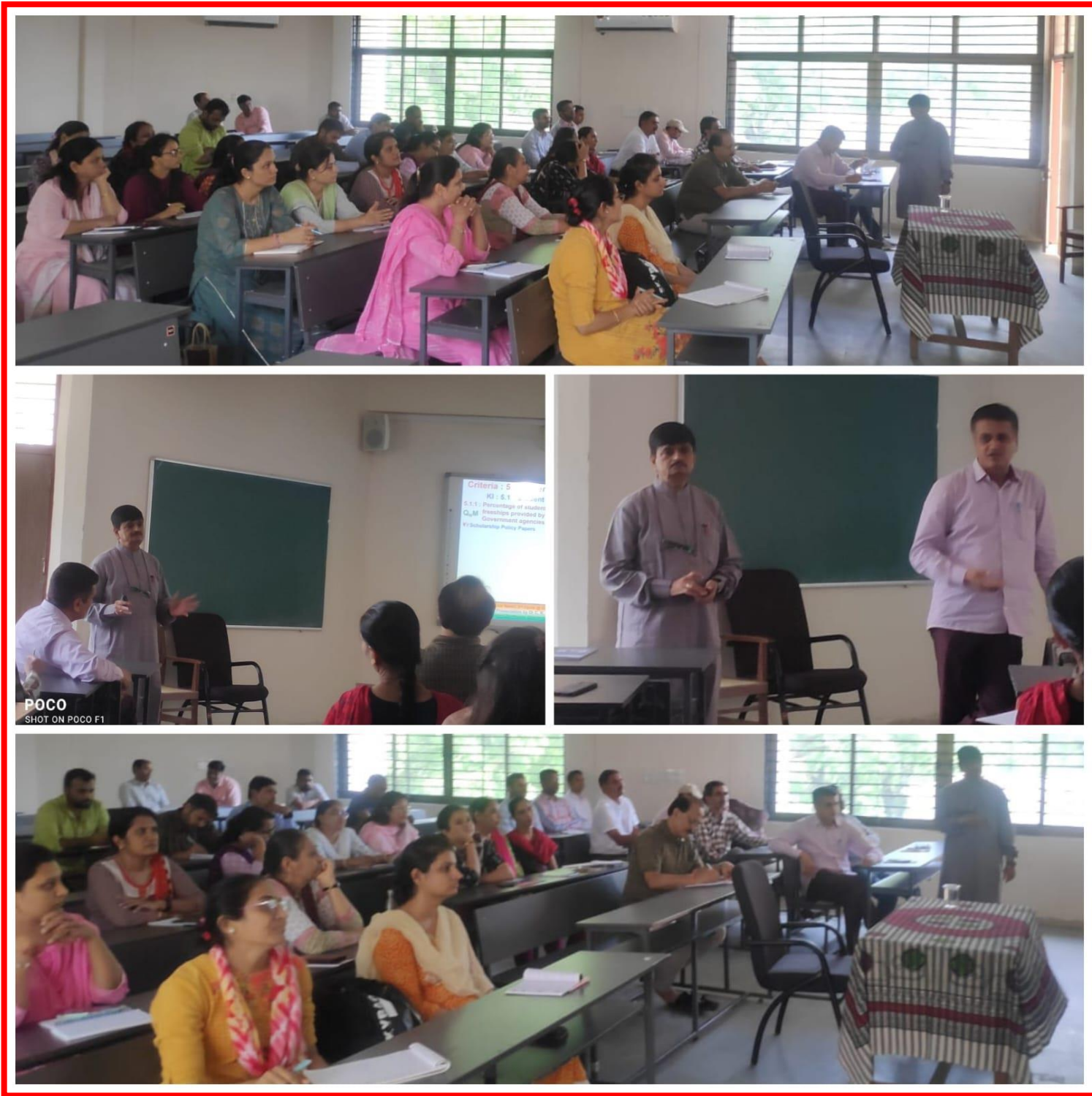
(Pictures of Day 7 of Capacity Building Week was organized by Government Science College, Gandhinagar from 19 June 2023 to 24 June 2023.)