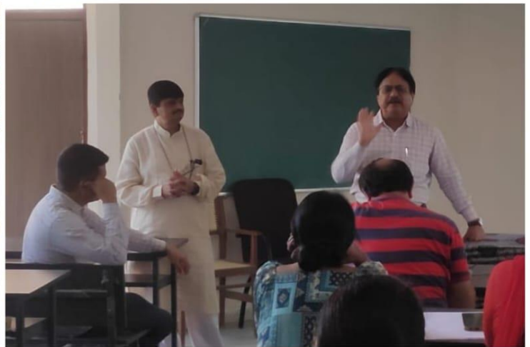
(Pictures of Day 2 of Capacity Building Week was organized by Government Science College, Gandhinagar from 19 June 2023 to 24 June 2023.)