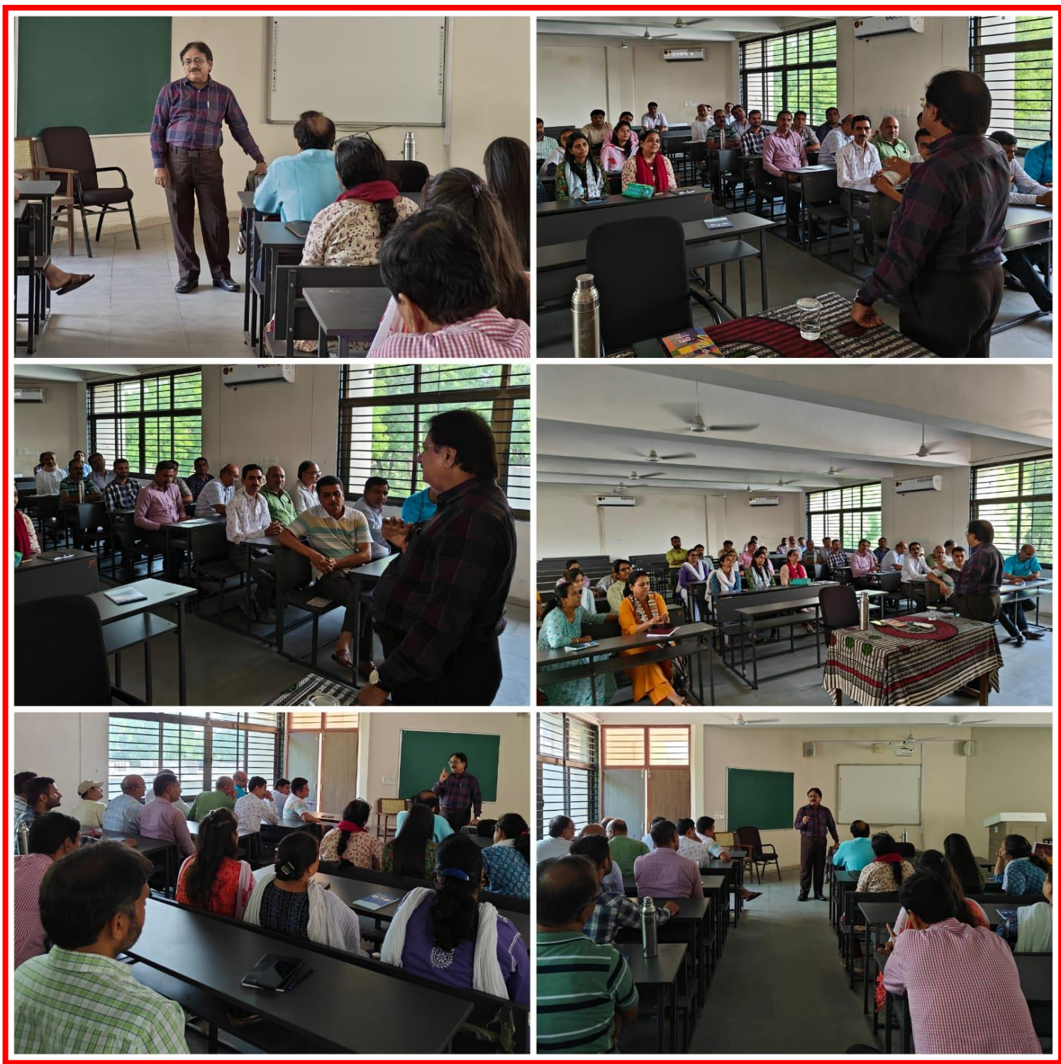
(Pictures of Day 4 of Capacity Building Week was organized by Government Science College, Gandhinagar from 19 June 2023 to 24 June 2023.)